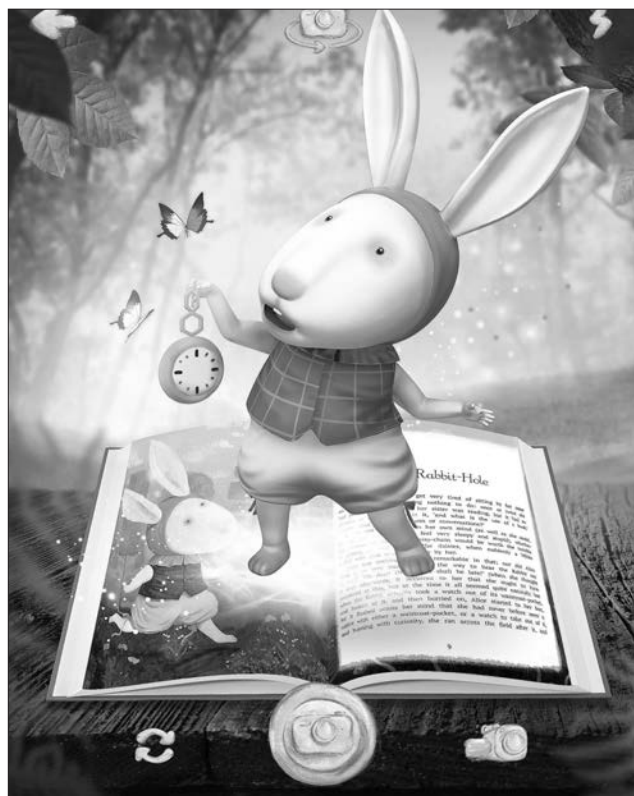
Розпізнати картинку, що оживає, допоможе спеціальна позначка з кроликом, який біжить

Ця книжка — перше українське видання з доповненою реальністю. Під час презентації частину накладу подарували дітям героїв АТО і представникам інших пільгових категорій.