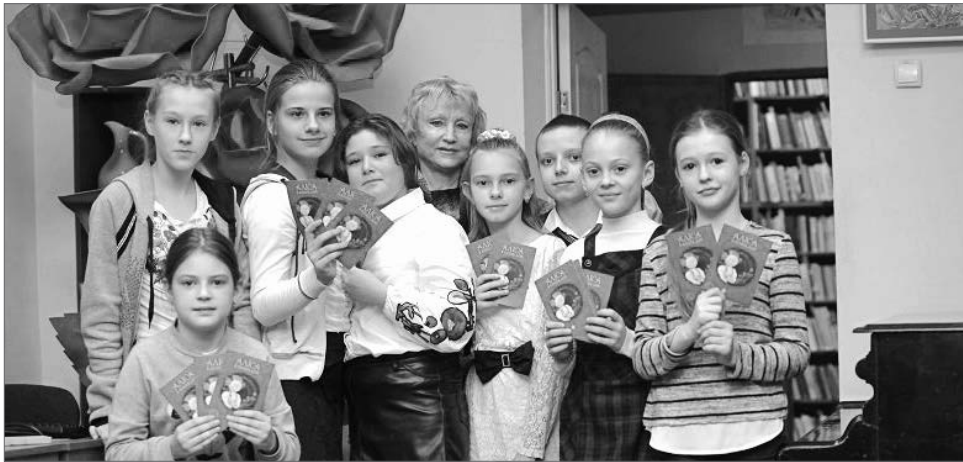
Перші читачі вже у захваті

Самобутні персонажі художниці Євгенії Гапчинської — зворушливі, наївні, кумедні та дуже милі надають знаменитій казці англійського письменника душевності й затишності. Її Аліса зовсім не схожа на жодну свою попередницю. Це чарівна дівчинка з рожевими щічками і круглим личком, проте вона особлива, тому й подорож у краї-