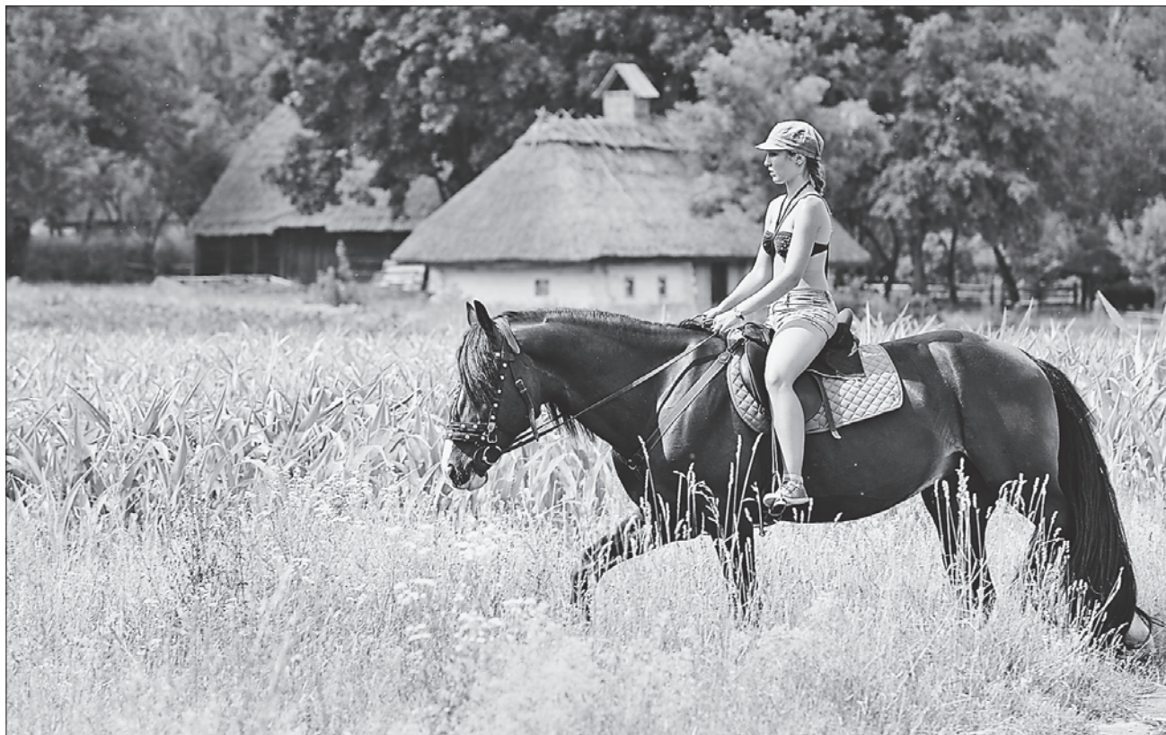
Усе радіє літу, яке дарує тепло, духмяний запах трав і розваги на природі

НАРОДНІ ПРИКМЕТИ. На Онуфрія сонце повертає на зиму, літо — на спеку