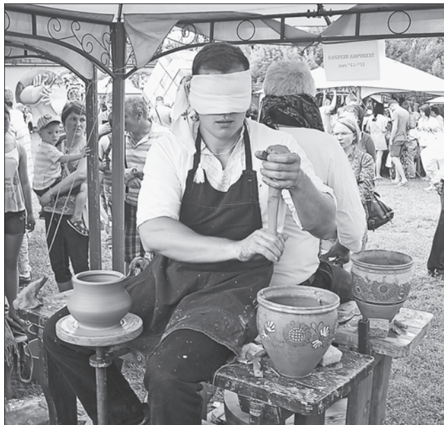
Справжній майстер виготовить макітру і з зав'язаними очима

Для професіоналів гончарної справи на території музею-заповідника організували чотири профільні виставки, найпомітнішою з яких стала виставка кераміки гончарів села Цвітне Олександрівського району Кіровоградської області. Сьогодні цього осередку вже не існує, а ще в 1930-х роках він був найбільшим на Правобережжі. У Цвітньому жило май-