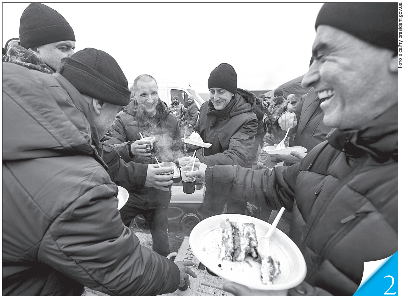
На рідній землі наших зустріли теплом і гостинністю

ДОЧЕКАЛИСЯ! Напередодні свят відбувся другий обмін полоненими між нашою країною та стороною агресора