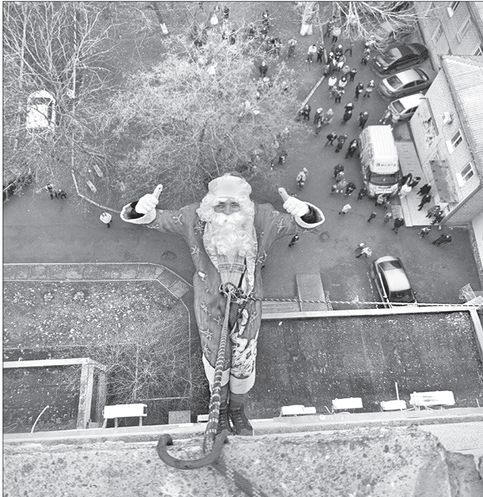
До пацієнтів лікарні з даху спустилися вісім Дідів Морозів

У результаті сюрприз видався на славу, і діти, і дорослі отримали заряд позитиву на всі свята. А на думку медичних працівників, гарні емоції сприятимуть якнайшвидшому одужанню маленьких пацієнтів.