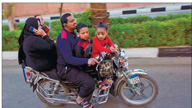
У 100-мільйонному Єгипті щороку на світ з'являється понад 2 мільйони немовлят

Того самого року уряду вдалося заручитися підтримкою Університету аль-Азхара, одного з найпрестижніших духовних мусульманських освітніх закладів світу. В університеті дійшли висновку, що планування сім'ї ісламські закони і звичаї не забороняють. Першу фетву, богословсько-правовий висновок в ісламі з цього питання, університет видав ще 1937 року. У підсумку 2018-го за участю ООН було запроваджено програму з газлом «Двоє досить», мета якої — просування ідеї, що в єгипетській родині вистачить двох дітей, про що і сказав ас-Сісі. Ця програма орієнтована передовсім на найбільш у верству населення, де в сім'ях троє або більше дітей.