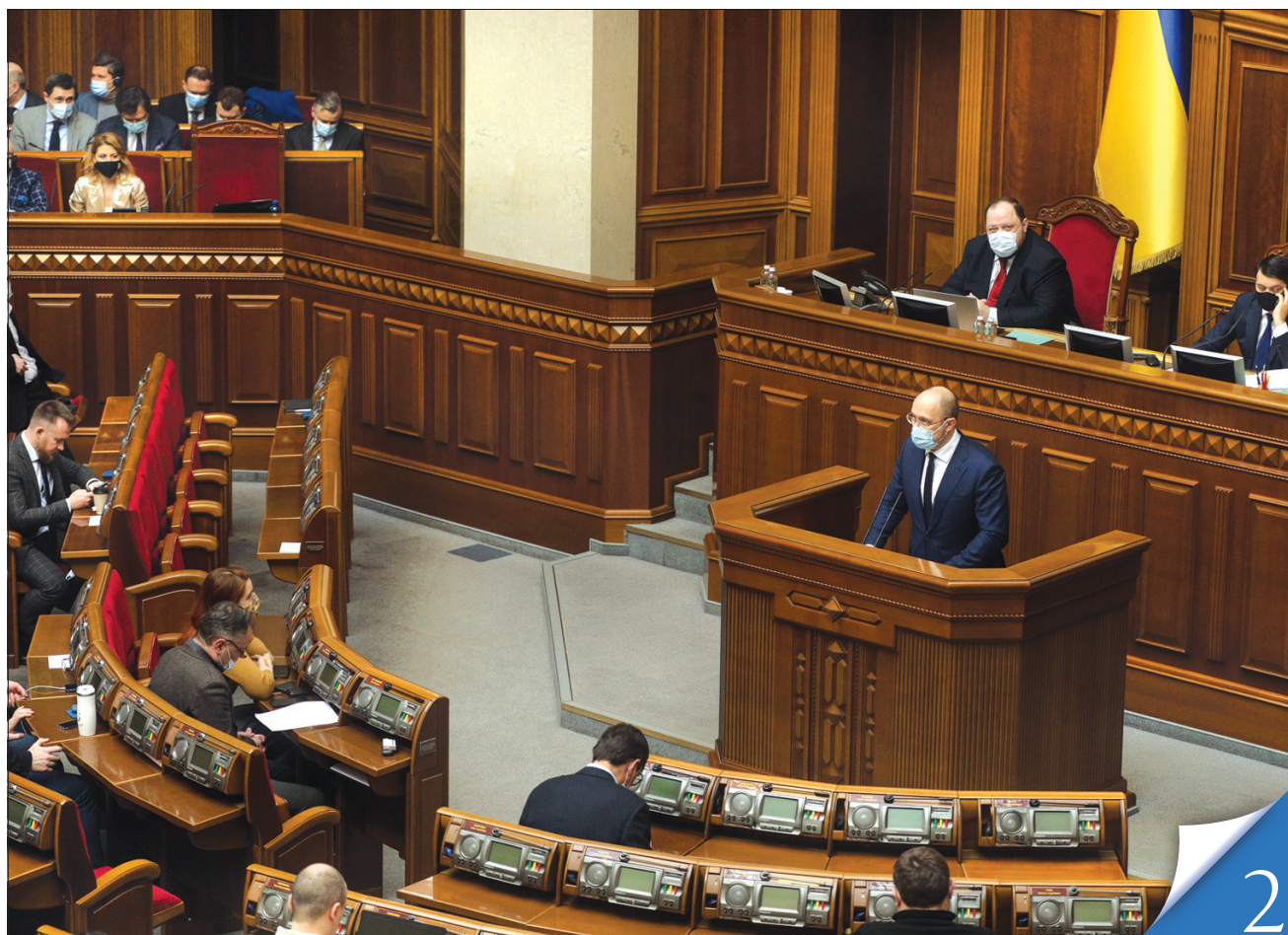
Парламентарії заслухали докладний звіт Дениса Шмигала про роботу української делегації в інституціях ЄС