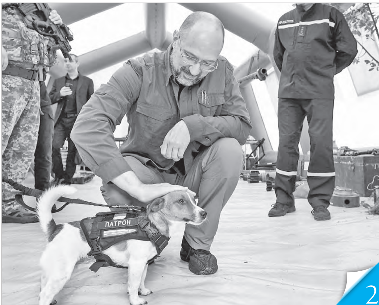
Глава уряду подякував за професійну роботу саперам, серед них — і славнозвісний Патрон