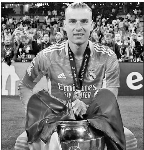
Вихованці Красноградської ДЮСШ на вищому футбольному рівні: Андрій Лунін із Кубком Ліга чемпіонів (ліворуч) та Михайло Мудрик у складі «Челсі»

І справді, у першому ж матчі у футболці лондонського клубу Михайло Мудрик залишив незабутнє враження на полі, а після гри отримав багато схвальних відгуків від англійських експертів та вболівальників. Вийшовши на заміну на початку другого тайму в матчі проти «Ліверпуля», українець одразу пожвавив гру своєї команди, відзначився створенням кількох гострих моментів, допоміг суперникам заробити жовту картку і був близьким до гола, однак закрити яскравий дебют влучним м'ячем не вдалося. Та в нього все попереду. Сподіватимемося й на його успіхи в національній збірній, за яку він дебютував торік у травні та відзначився голом