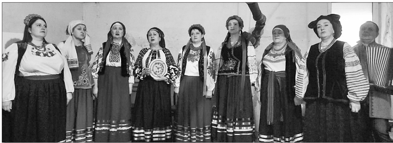
Невмируще Шевченкове слово лунає в укритті