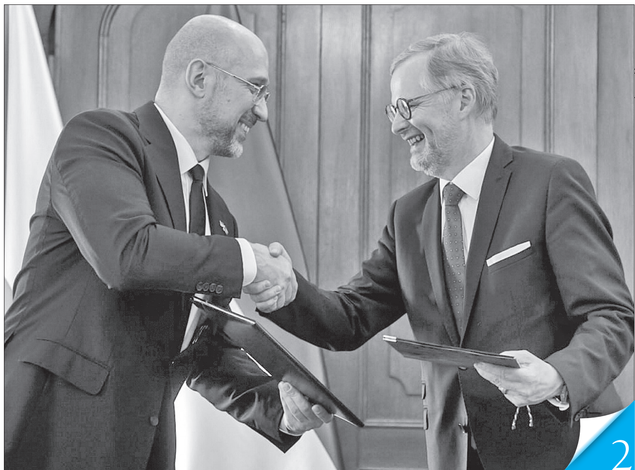
Прем'єр-міністри Денис Шмигаль і Петер Фіала підписали спільну заяву, в якій відображені результати домовленостей

СПІВПРАЦЯ. Україна та Чехія підписали документи за підсумками спільних консультацій урядів