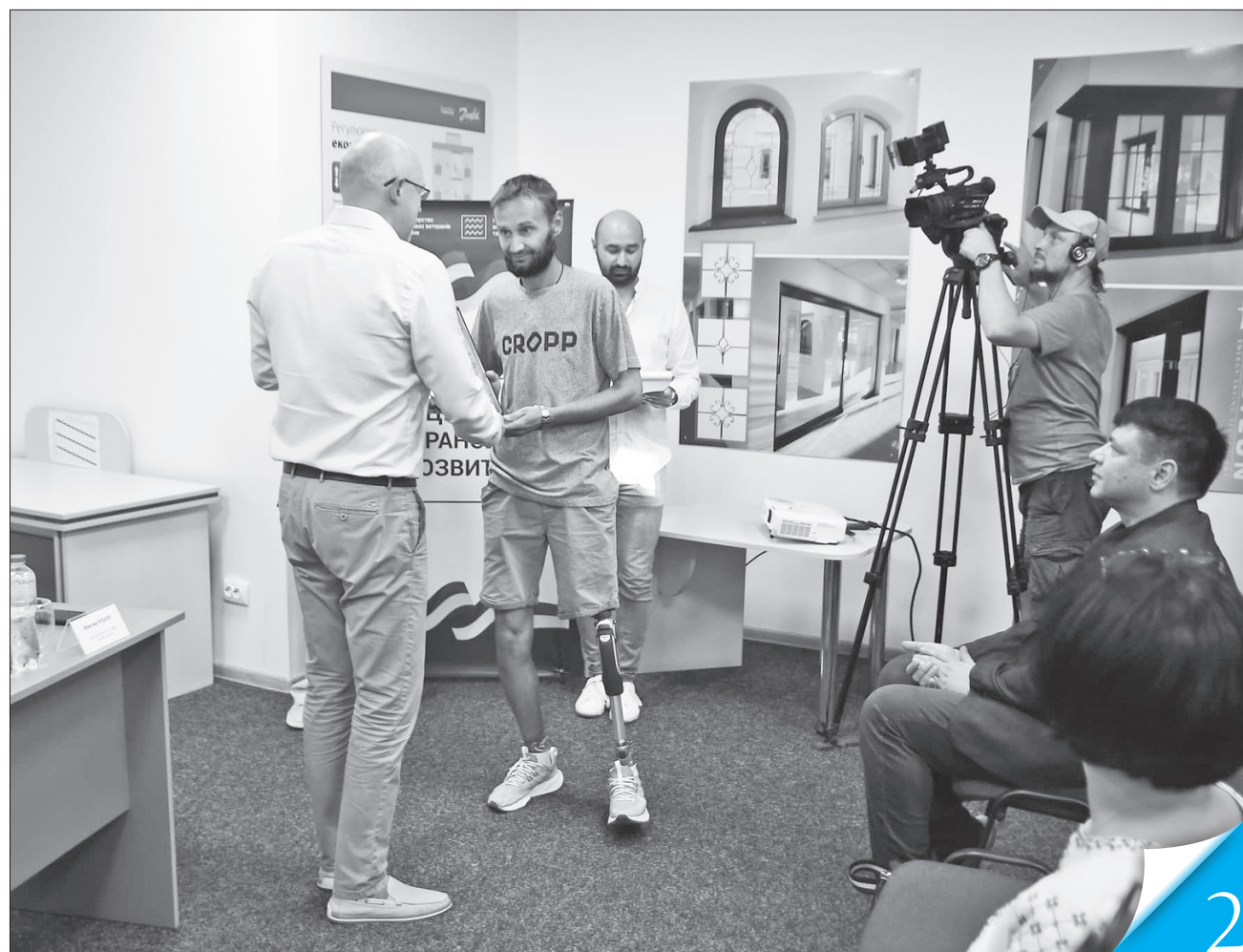
Під час зустрічі із заступником міністра Максимом Кушніром ішлося про посилення співпраці у впровадженні нової ветеранської політики у громадах