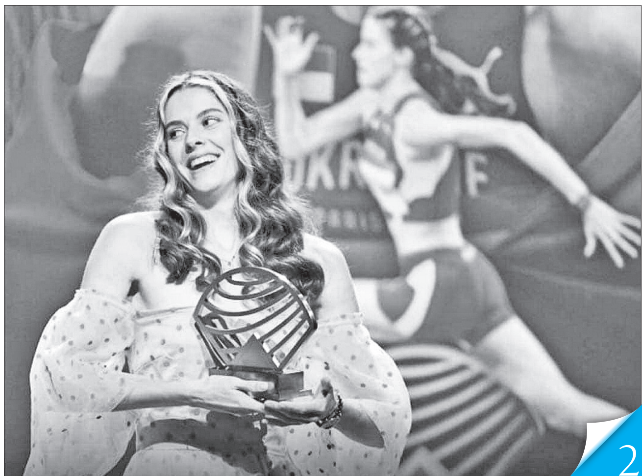
Визнана найкращою легкоатлеткою світу 2024 року в небігових дисциплінах олімпійська чемпіонка зі стрибків у висоту Ярослава Магучіх у власний спосіб показує, що українці сильні й ніколи не здаються

КОД НАЦІЇ. У Києві відбувся Міжнародний форум «Сила спортивної дипломатії»