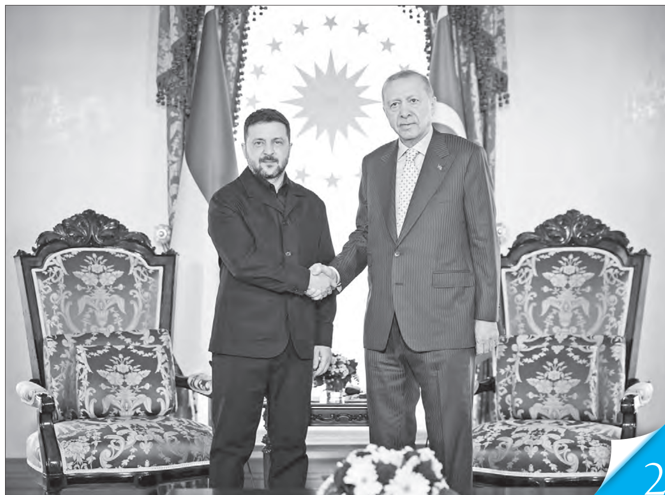
У палаці Долмабахче в Стамбулі Володимир Зеленський провів зустріч із Реджепом Таїпом Ердоганом

ВЗАЄМОДІЯ. Президент України обговорив ситуацію на Близькому Сході та в регіоні Затоки з лідерами Туреччини і Сирії