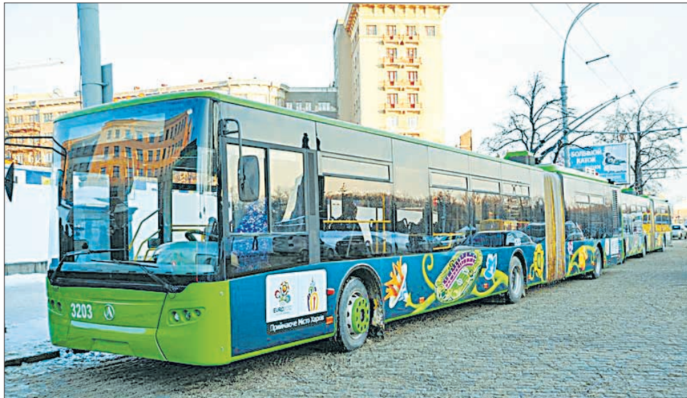
До кінця 2011 року Харків закупить 97 тролейбусів

Остання новина про те, що в рамках підготовки до чемпіонату в місті обладнають вертолітний майданчик для надання медичної допомоги учасникам та гостям турніру, в черговий раз отримала схвальний відгук у інспекторів УЄФА, котрі відвідали першу столицю на початку березня нинішнього року. Розповідаючи про підготовку Харкова до Євро-2012 під час робочої наради, що відбулася у міськвиконкомі за участі операційного директора Турніру Євро-