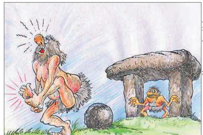
Пенальті у кам'яному віці

Європейські футбольні рефері вважають, що їхні помилки — це частина гри. Деякі наші — частина зарплатні.