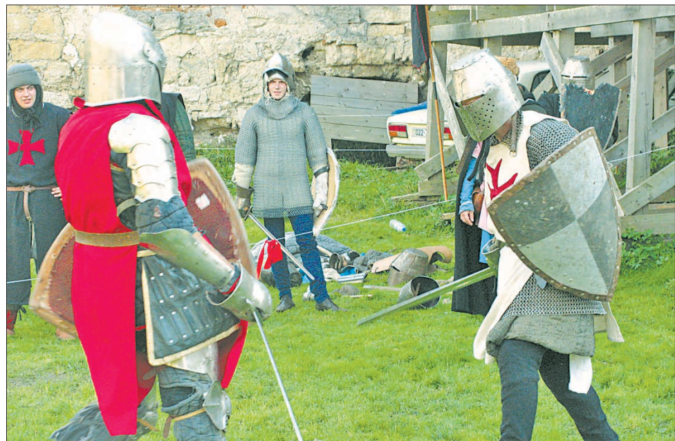
У замку Синавських у Бережанах торік почали зорганізувати лицарські бої