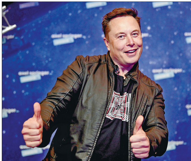
Власник SpaceX і генеральний директор Tesla Ілон Маск

«У мене не залишиться майже нічого цінного з фінансової точки зору, не рахуючи акцій компанії. Коли на роботі напружена ситуація, я спати на території фабрики або в офісі. Очевидно, потрібне житло, адже в мене діти. Але можу його орендувати», — каже Ілон Маск.