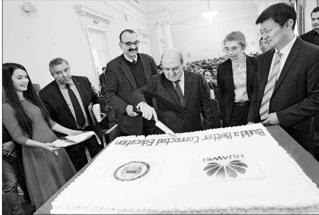
Представники сторін за традицією розрізали святковий торт — символ подальшого успіху

Зокрема ректор Київського національного університету імені Тараса Шевченка Леонід Губерський відзначив виняткову результативність співпраці з компанією, що розпочала-