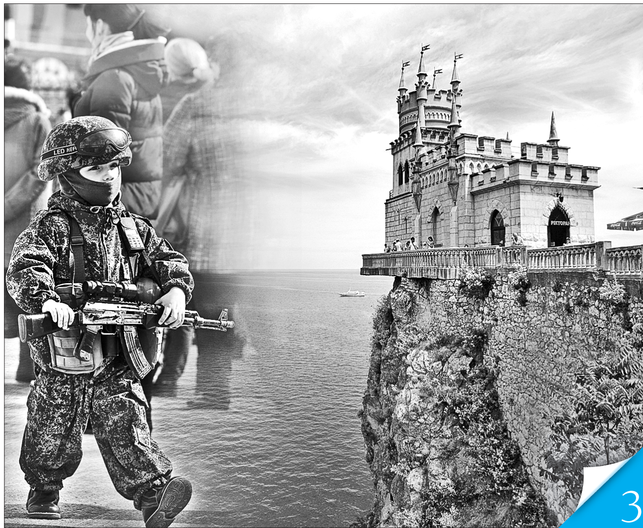
Колаж Ірини НАЗІМОВО

ГОСТРА ТЕМА. Для Росії мілітаризація півострова важливіша за його розвиток