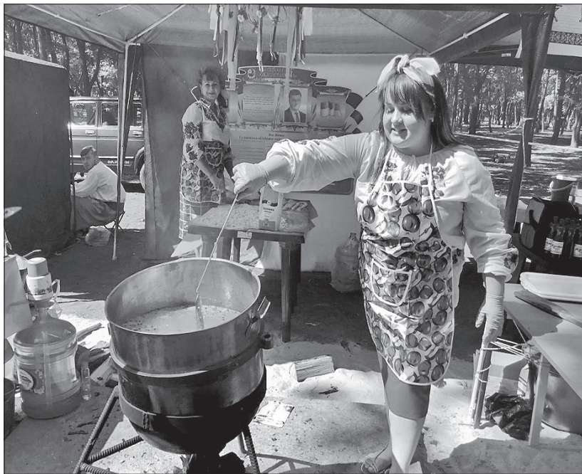
Український борщ був дуже популярним серед гостей свята у Краматорську

Куштували і оцінювали страви місцеві жителі, у присутності яких у місцевому парку все апетитно шкварчало, булькало, кипіло й апетитно пахло. Позитивні відгуки отримали всі зусилля кухарів, зокрема плов і галушки. А більшість голосів набрав гарячий борщ, 50 літрів якого з апетитом з'їли гості і представники авторитетного журі.