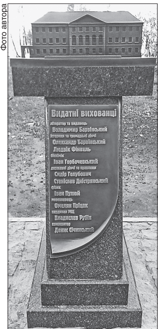
Зруйновану будівлю першої державної гімназії в Тернополі відтворили у бронзі