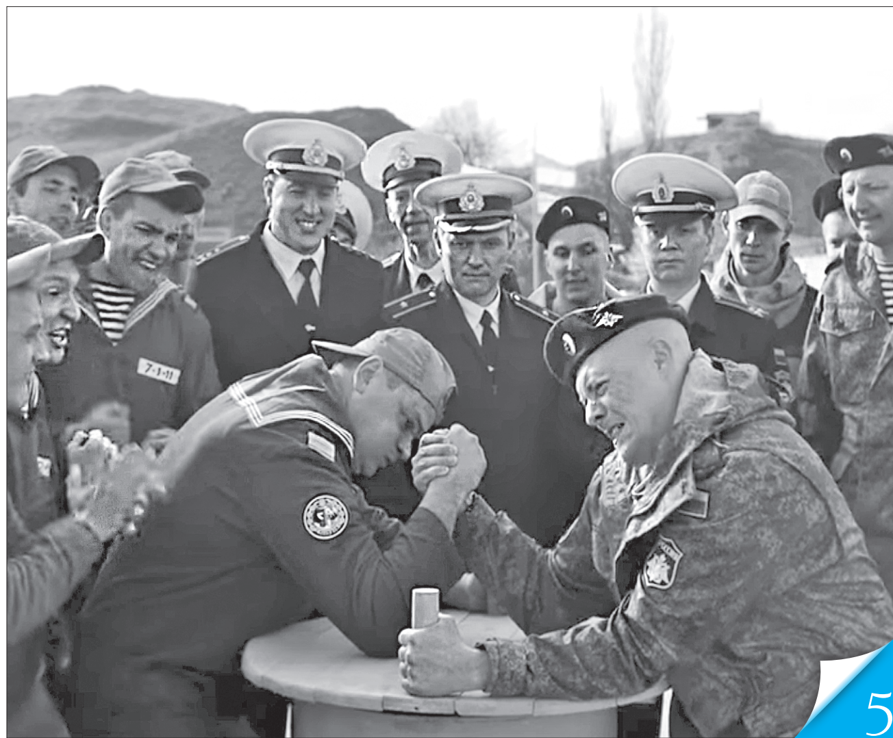
Сюжет для стрічки «Черкаси» підкинула російська окупація Криму, а допомогло втілити Держкіно

ІДИ Й ДИВИСЯ! Про зрілість і сучасність вітчизняного кінематографа свідчить відповідність світовим тенденціям