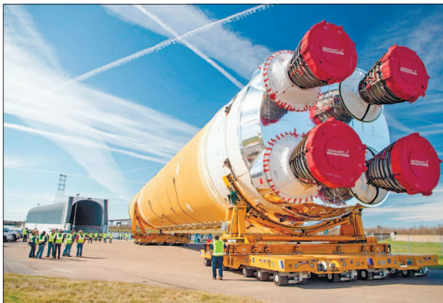
SLS, найпотужніша ракета в історії NASA, за допомогою якої США хочуть відрядити людей на Місяць

Канадський астронавт візьме участь у запланованій місії NASA програми «Артеміда II», а CSA матиме місце в майбутньому польоті до «Місячного шлюзу», коли його буде завершено. Приєднавшись до місії «Артеміда II», Канада стане другою кра-