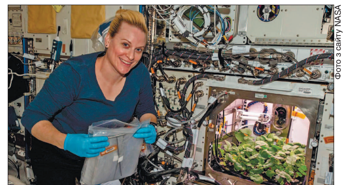
Кейт Рубінс збрала врожай космічної редиски, що виростала в середовищі Advanced Plant Habitat

Експеримент NASA дасть змогу фахівцям визначити оптимальний догляд за рослинами для найбільшого врожаю. Вирощування в космосі редиски не потребувало особливих зусиль, зазначають астронавти. Фахівці NASA планують до кінця десятиліття досліджувати можливості для вирощування рослин на Місяці.