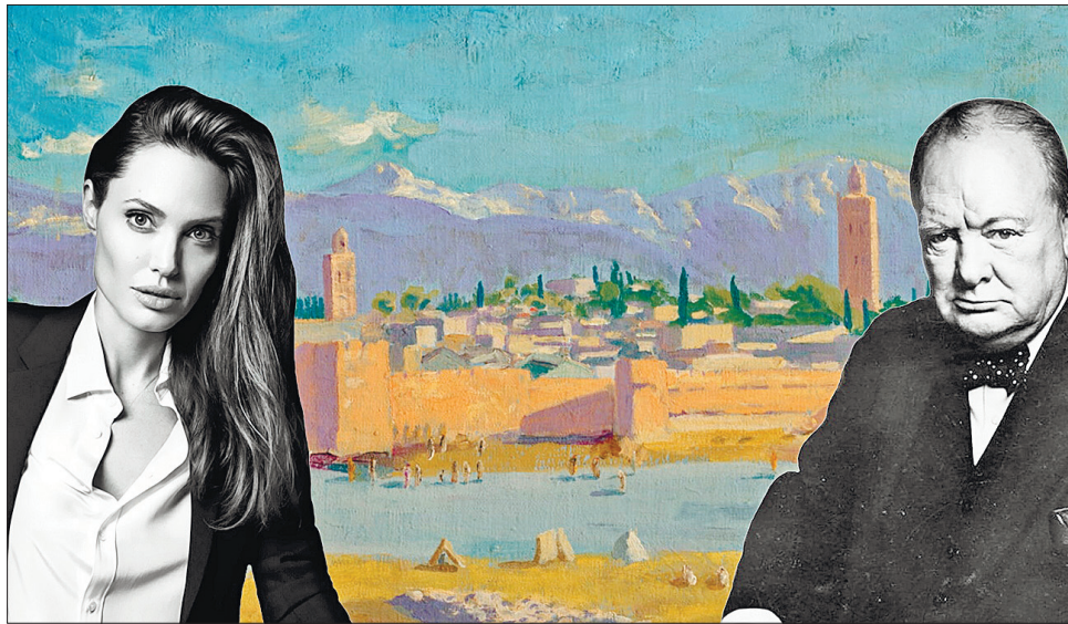
Автор твору Вінстон Черчилль не міг передбачити, що Анджеліна Джолі продасть «Мінарет мечеті Аль-Кутубія» за рекордну суму

На картині, виконаній у жанрі пейзажу і стилі постімпресіонізму, зображено захід сонця над най-