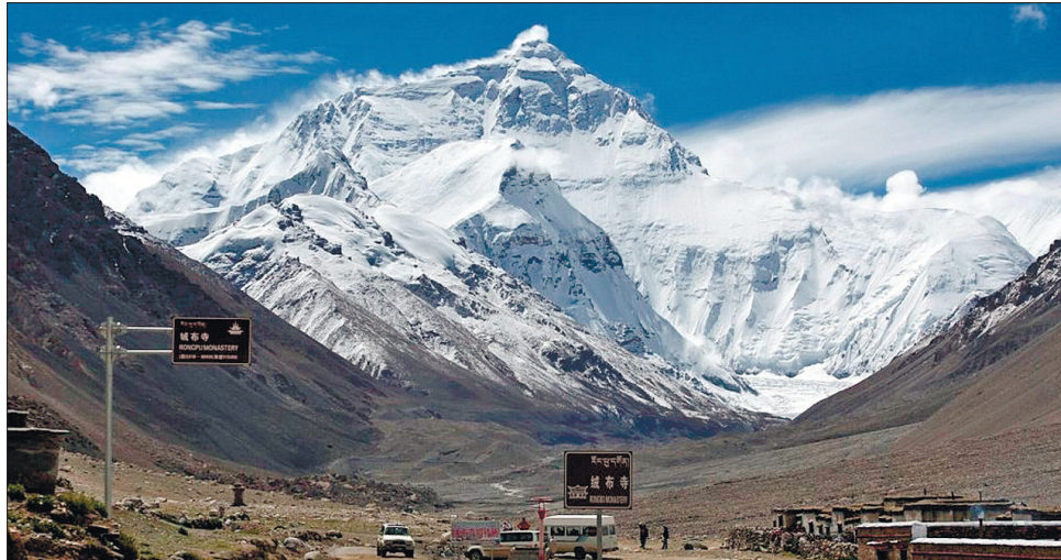
Зростання кількості хворих змусило оператора міжнародної експедиції піднімання на Еверест відмовитися від своєї мети

Зростання кількості хворих змусило оператора міжнародної експедиції піднімання на Еверест відмовитися від своєї мети. У заяві, надісланій СНВ, очільник експедиції австрій-