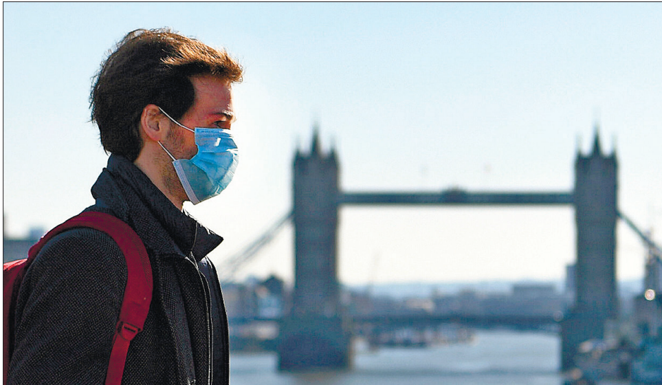
Британський уряд відхилив пропозицію видати громадянам ЄС картку на проживання

Британський уряд відхилив пропозицію видати громадянам ЄС картку на проживання. Хоча теоретично можливість отримати посвідку на постійне