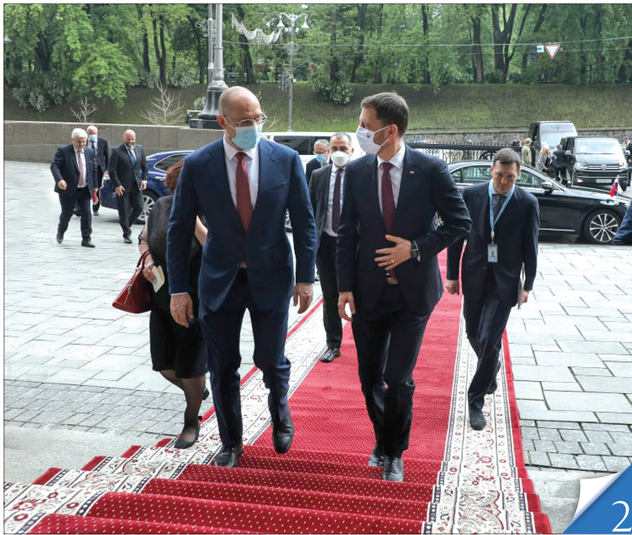
Свій перший офіційний візит до України в статусі Прем'єр-міністра Словаччини Едуард Хегер здійснив в умовах світової боротьби з пандемією коронавірусу

ПАРТНЕРСТВО. Київ і Братислава узгодили подальші кроки двосторонньої співпраці в європейському контексті