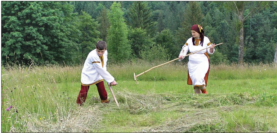
Сінокос для українців це не просто важка робота, а дійсно, оповите ритуалами й усталеними традиціями

Цьогорічна весна не порадувала нас теплом. Дощами та грозами, а подекуди снігом і морозами засвідчив свій мінливий характер травень. Оскільки перший місяць літа — пора сінокосів, висока вологість пішла на користь лукам і пасовиськам. Вони вкрились розкішним різнотрав'ям. Вистачить худобі на пашу і для заготовлі на зиму. «Рано вранці, до зорі, вийшли в поле косарі», «Коси коса, поки роса», «Травневі роси — на щедри покоси» — такі приказки здавна побутують у вжитку трудівників села. А чи буде врожайною хліборобська нива? Це вже значною мірою залежить від погодних умов першого літнього місяця. Червень урожай замовляє — стверджує народна мудрість. До нашого часу хлібороби свято дотримуються прадідівських обрядів і прикмет щодо замовлянь майбутнього врожаю. У червні старі люди вшановують обряди та спостерігають за народними прикметами у дні релігійних свят: Івана Довгого (1), Ферापонта (7), Устини та Харитона (14).