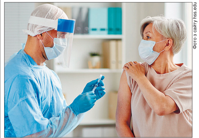
Темпи вакцинації визнано недостатніми в усьому світі

За даними ВООЗ, у країнах-членах ЄС 36,6% населення отримало одну дозу вакцини, а 16,9% повністю провакциновано.