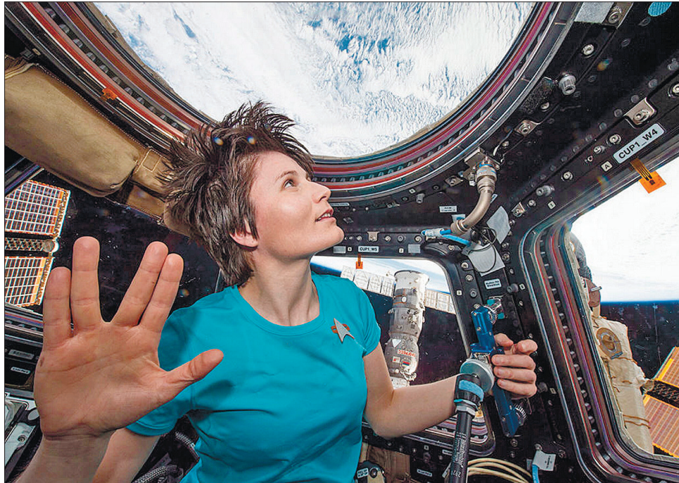
Саманта Крістофоретті вже була на МКС. 2014 року вона провела на орбіті 199 днів

«Висування Саманти на посаду командира Міжнародної космічної станції надихає молодих людей, які надсилають свої анкети на вступ до корпусу астронавтів ESA», — заявив генеральний директор агентства Йозеф Ашбахер. Він