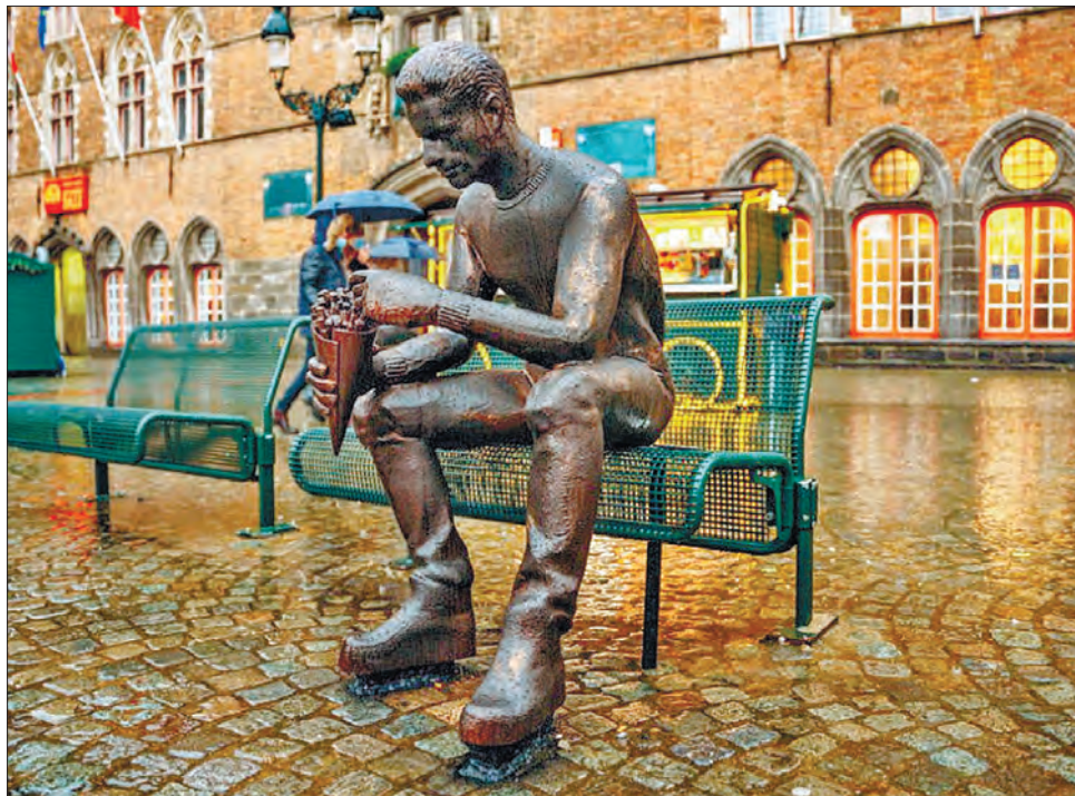
На Ринковій площі міста Брюгге з'явилася скульптура De Frieteters — «їдець картоплі фрі»

І хоч нині ледь не в кожній країні картоплю фрі подають і в дешевих забігай-