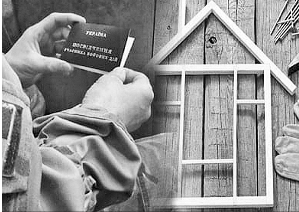
Чи будуть у фокусі люди, для яких потреба в житлі першочергова?

«Проте грошей на всіх не вистачало, тому таку пільгу молодій родині було отримати досить складно. Бу-