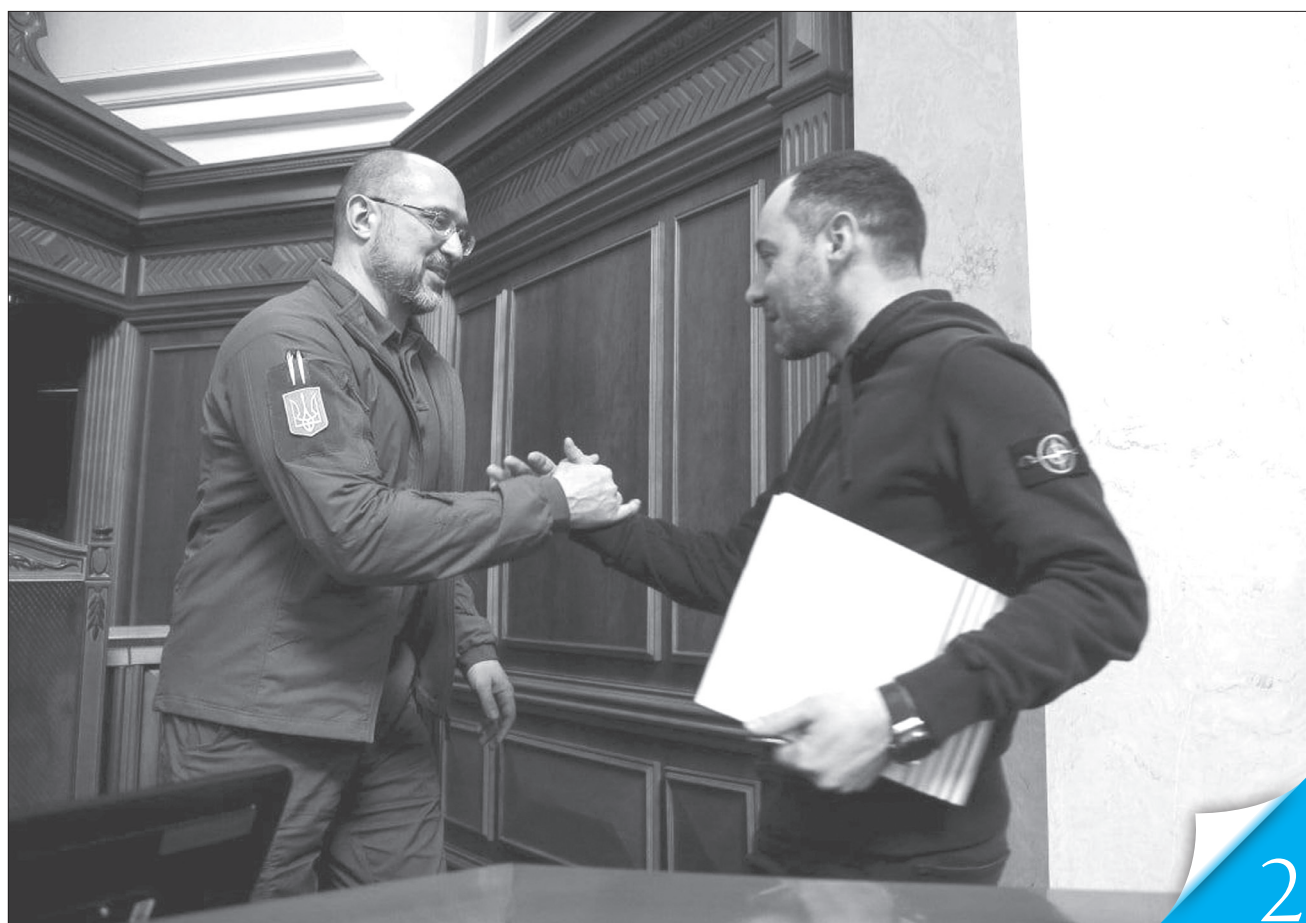
Нового заступника керівника уряду з призначенням на посаду привітав Прем'єр-міністр Денис Шмигаль

ПРИЗНАЧЕННЯ В УРЯДІ. Віцепрем'єр-міністром з відновлення — міністром розвитку громад, територій та інфраструктури став Олександр Кубраков