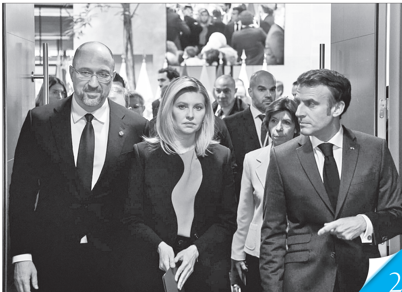
Денис Шмигаль, Олена Зеленська та Еммануель Макрон впевнені, що світова спільнота допоможе Україні пережити зиму

ПЛІЧ-О-ПЛІЧ. У Парижі за участі керівників світових і європейських інституцій, лідерів провідних країн та керівництва нашої держави пройшла міжнародна конференція «Солідарні з українським народом»