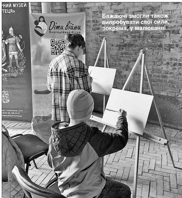
Бажаючі змогли також випробувати свої сили, зокрема, у малюванні