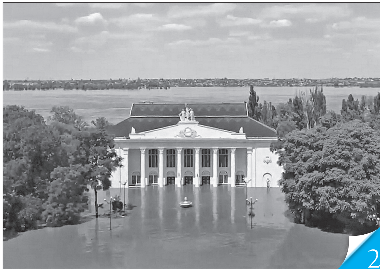
Внаслідок російського теракту затоплено Нову Каховку

ЗЛОЧИНЦІ СКАЖЕНІЮТЬ. До катастрофічних дій окупанти вдалися, щоб сіяти паніку, хоч і самі панікують через анонсований контрнаступ наших захисників