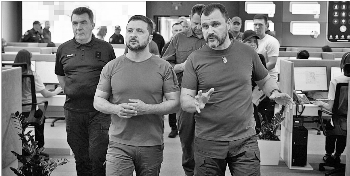
Міністр внутрішніх справ Ігор Кліменко ознайомив Президента з роботою аналітичного центру «Безпечна країна» та єдиної інтеграційної платформи системи МВС

Володимир Зеленський також подякував усім слідчим Національної поліції України, які розслідують кримінальні правопорушення, зокрема воєнні злочини.