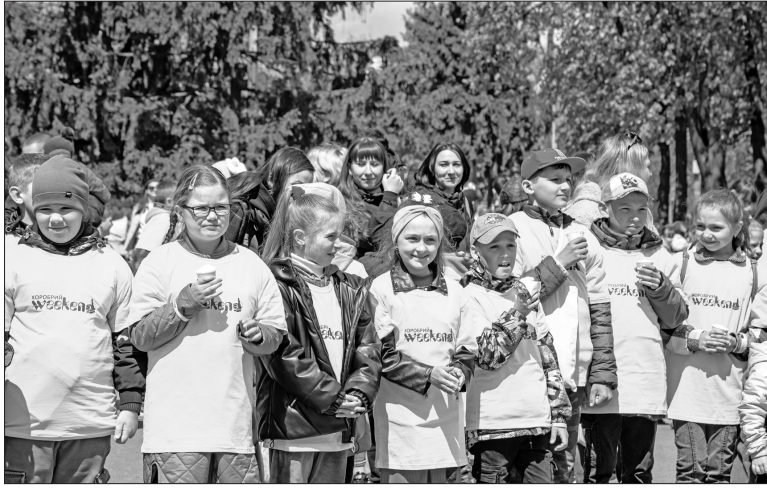
На заходах просто неба дітлахи почувалися невимушено і захоплюю

За словами організаторів проекту, умови життя на Сумщині, прикордонні території якої й нині перебувають під обстрілами, обмежують навчання, спілкування, самореалізацію дітей. Особливо це впливає на синів і доньок загиблих воїнів, які перебувають удома, де дорослі також переживають горе. Психологічні труднощі відчувають дітлахи, чий батьки нині на фронті, і це стало значною психологічною проблемою. Тож і звернулися до надійних парт-