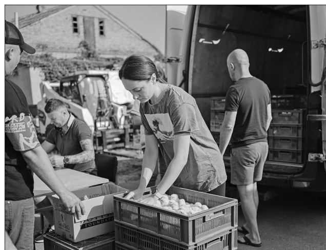
Роздавали курчат у Дергачівській громаді організовано