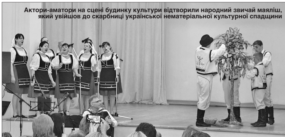
Актори-аматори на сцені будинку культури відтворили народний звичай маяліш, який увійшов до скарбниці української нематеріальної культурної спадщини

Ще до початку перегляду присутні в залі жваво обговорювали, як це колись відбувалося. «Тоді люди були скромніші і цнотливіші, ніж тепер. Виказувати свої почуття й зізнаватися в коханні з такою легкістю, як сьогодні в молоді, було не заведено, але ось такими символічними і красивими вчинками юнаки заявляли про себе, про свої