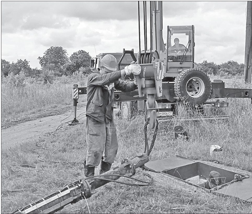
Фахівці водоканалу здійснюють генеральну перевірку артезіанських свердловин

Ось і недавно в Сумах на проспекті імені Михайла Лужши застосували новітню технологію під час ремонту самопливного колектора 500-міліметрового діаметра упродовж тижня на майже 4-метровій глибині. Цінність і новизна в тому, що роботи вели без відключення водопостачання у великому мікрорайоні з десятками багатопверхівок на вулицях Івана Сірка, ЗСУ та прилеглих до них. У середину 14-метрової аварійної залізобетонної труби, яку використовували як арматуру, майстри вживили сучасну пластикову трубу СПРОКОР трохи меншого діаметра