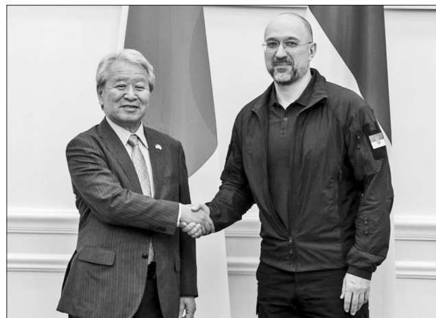
Денис Шмигаль підкреслив у розмові з Акіхіко Танакою, що Україна цінує намір JICA відкрити офіс у Києві

Володимир Зеленський та Акіхіко Танака обговорили пріоритетні напрями діяльності агентства JICA в Укра-