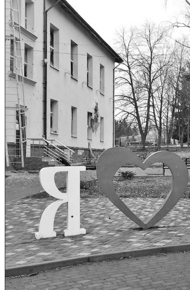
Таким, на жаль, Бахмут пам'ятають далеко не всі бійці 77 бригади. Бо такий вигляд місто мало ще до приходу «руського міра»

Під контролем Сил оборони України на той час залишилися тільки будівлі в південно-західній частині біля скверу Дружби, де стояв знищений на початку березня літак-пам'ятник МіГ-17. Тому не лише на Заході, а й всередині України лунали заклики здати місто, яке, мовляв, не має великого стратегічного значення. Однак на думку Верховного Головнокомандувача, українським військам необхідно було утримати Бахмут із двох причин: по-перше, якщо окупанти займуть місто, то це відкриє їм шлях для захоплення інших міст на сході України.