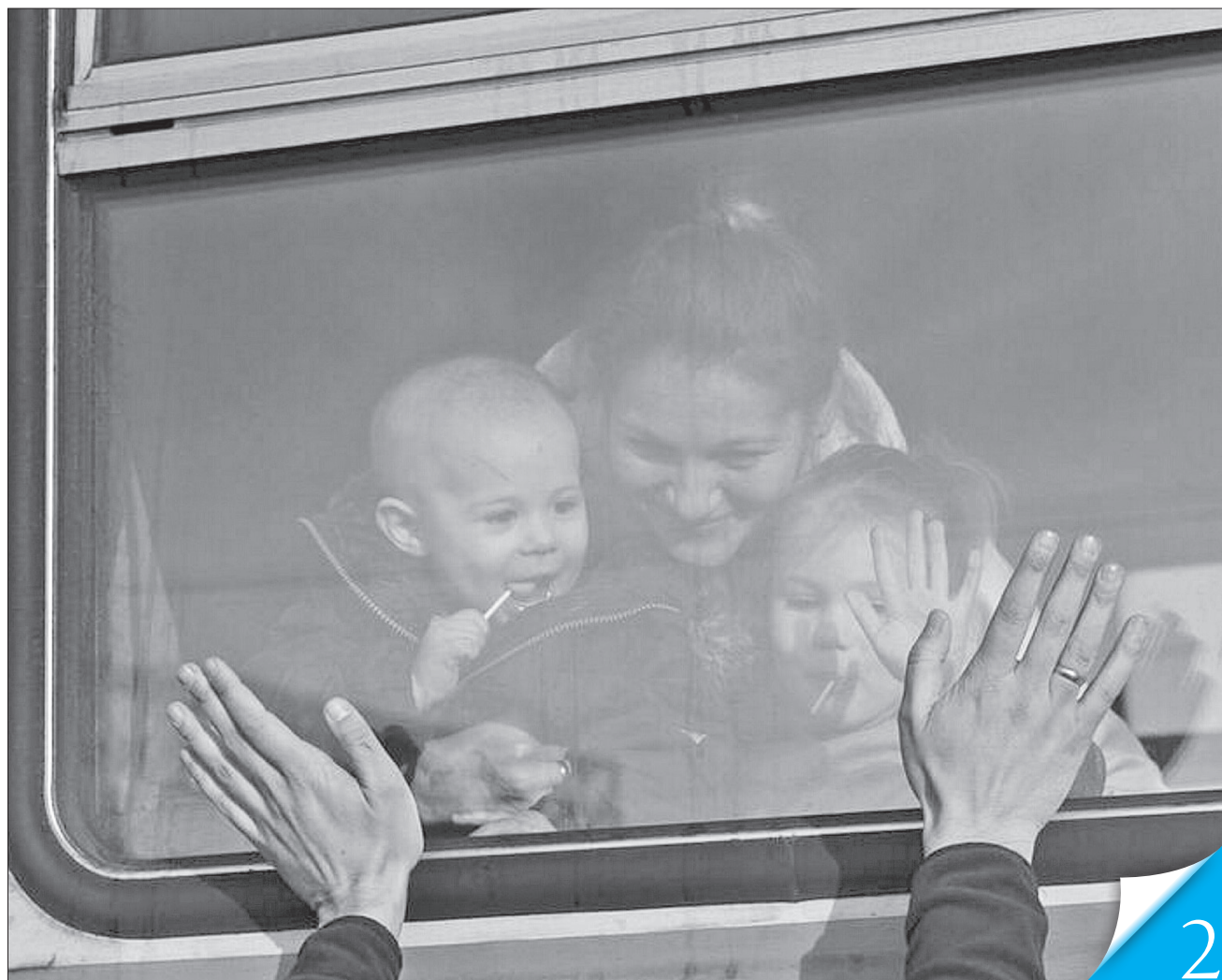
Евакуйовані отримують по 10 800 гривень на одну особу в родині

БЕЗПЕКА. Уряд спільно з ЮНІСЕФ запровадив додаткову фінансову допомогу для родин з дітьми із вразливих категорій, які евакуюються з Харківщини і Сумщини