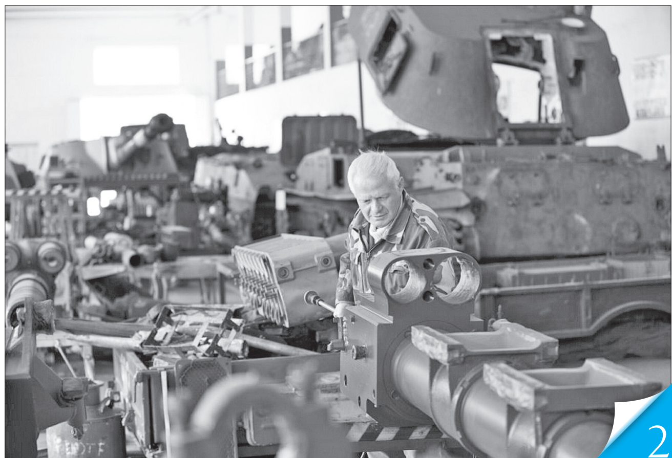
Загалом економіка продовжує адаптуватися та набувати характеристик воєнного часу

МАКРОПОКАЗНИКИ. За попередніми оцінками Мінекономіки, зростання ВВП у квітні 2024 року порівняно із квітнем торік становило майже 4,3 відсотка