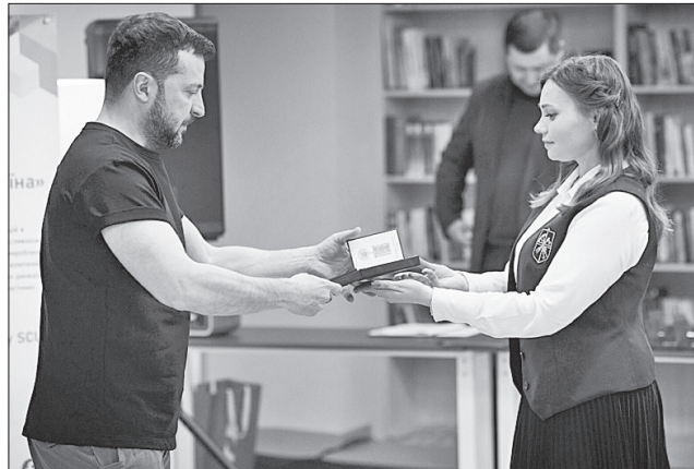
Глава держави привітав науковців із професійним святом та відзначив державними нагородами

Президент зазначив, що окремі розробки молодих уче-