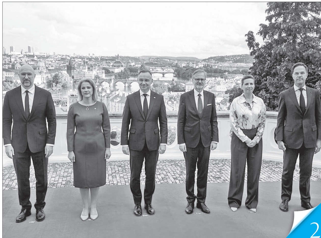
Денис Шмигаль наголосив на важливості того, що в Європі є лідери, які не просто розуміють, а діють, щоб Україна перемогла

ДІЯТИ СПІЛЬНО. Український Прем'єр провів у Празі широку робочу зустріч з лідерами Чехії, Польщі, Латвії, Данії, Нідерландів та представником США