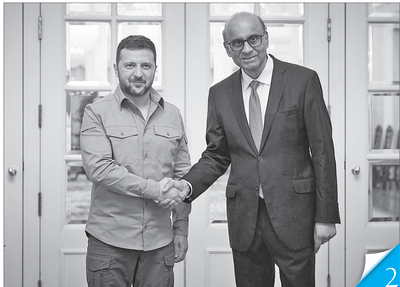
Володимир Зеленський подякував Президентіві Сінгапуру Тарманові Шанмугаратнамові за сприяння у розвитку людського потенціалу та спроможностей сектору державних послуг

БЕЗПЕКА БЕЗ КОРДОНІВ. Президент закликав лідерів і країни Азії долучитися до участі у Глобальному саміті