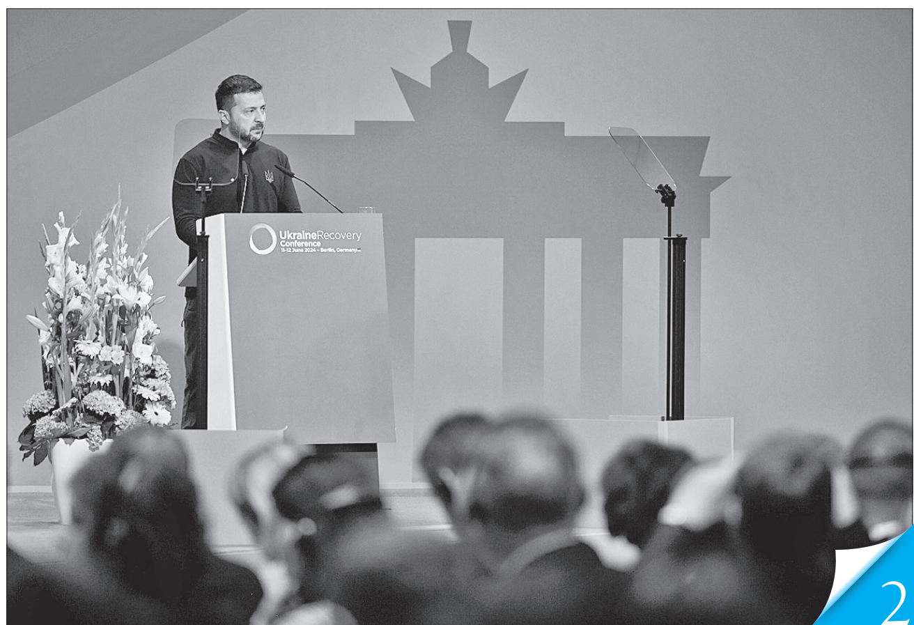
У виступі Президент України Володимир Зеленський зазначив, що такі заходи додають нам життєстійкості в умовах війни

ВИКЛИКИ. Міжнародна конференція з питань відновлення України в Берліні — майданчик для укладання важливих угод