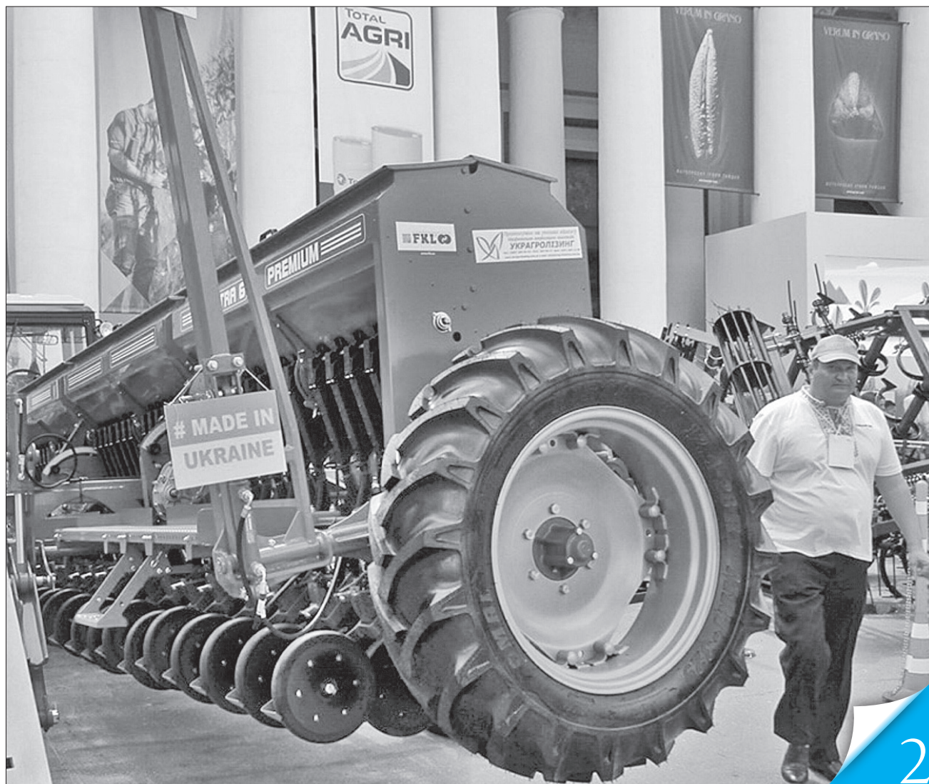
Учасників програми компенсацій аграріям за придбання сільгосптехніки українського виробництва дедалі більше

ФІЛОСОФІЯ РЕФОРМУВАННЯ. Під час години запитань до уряду народним депутатам презентували проміжні підсумки політики «Зроблено в Україні»