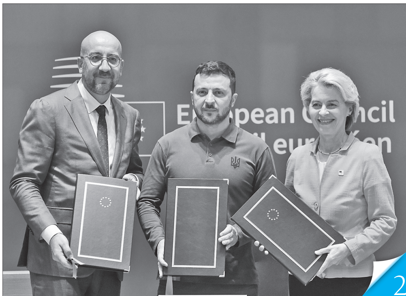
Підписи під документом поставили Президент Європейської ради Шарль Мішель, Президент України Володимир Зеленський і Президент Європейської комісії Урсула фон дер Ляєн

ЗАСАДНИЧИЙ ДОКУМЕНТ. Перед початком робочого засідання Європейської ради керівники України і ЄС у присутності лідерів країн-членів підписали Спільні безпекові зобов'язання між Україною і Європейським Союзом