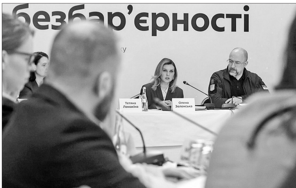
Прем'єр наголосив на локальному вимірі безбар'єрності, а Олена Зеленська презентувала Гайд безбар'єрних подій

«Організатори заходів — конференцій, виставок, будь-яких публічних зустрічей — орієнтовані на те, щоб бачити серед своїх учасників людей з досвідом війни. Але як це правильно організувати? Ми ніколи не знаємо, хто поруч з нами: що ця людина пережила і що бачила, в якому вона стані зараз. Але можемо заздалегідь створити рішення, які подарують усім гостям хороший досвід. Гайд безбар'єрних подій — саме про такі рішення. Про повагу до досвіду різних учасників. Він детально розбирає все — від комунікації до інтер'єру,