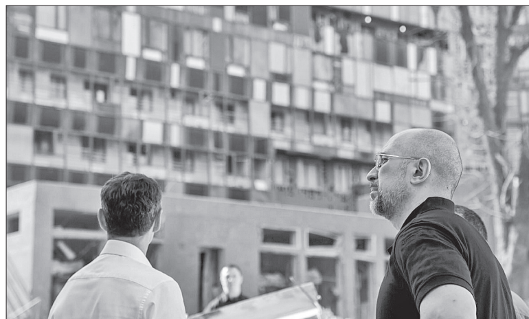
Прем'єр-міністр Денис Шмигаль на місці ознайомився з першочерговими потребами медзакладу

Глава уряду і міністр відвідали профільні медичні заклади, зокрема Центр дитячої кардіології та кардіохірургії МОЗ України та Національний інститут раку, які тимчасово прийняли частину пацієнтів.