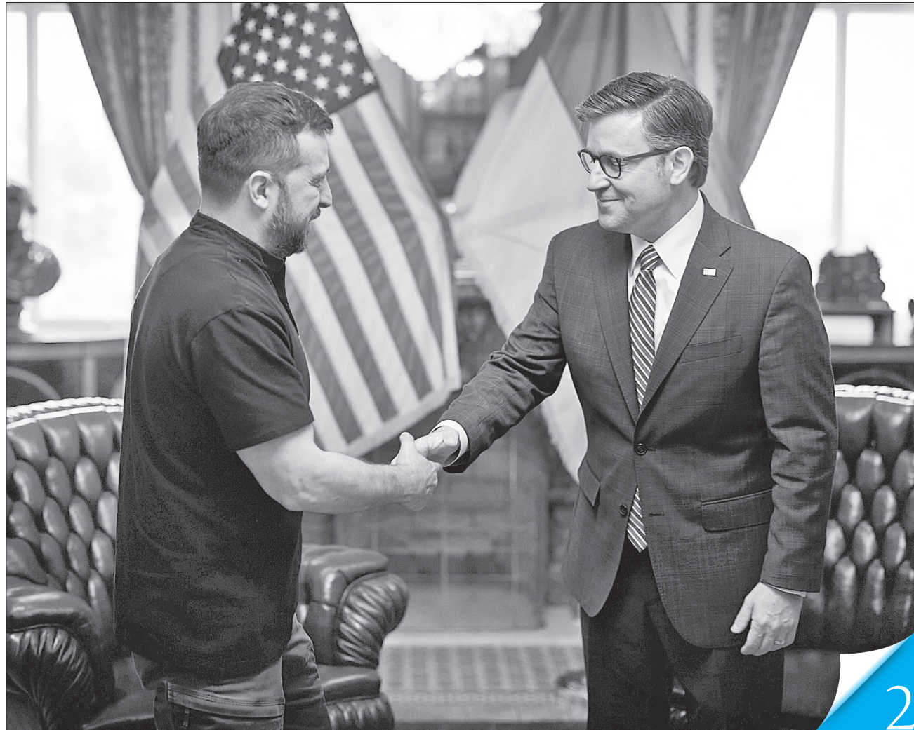
Під час зустрічі зі спікером Палати представників Конгресу США Майком Джонсоном Володимир Зеленський наголосив на важливості подальшої бюджетної підтримки та прозорому використанні допомоги

РОБОЧИЙ ВІЗИТ. Другий день роботи у США української делегації на чолі із Президентом був насиченим і плідним