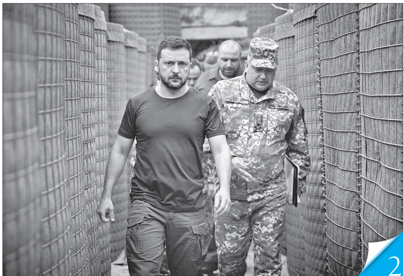
РОБОЧА ПОЇЗДКА. Президент Володимир Зеленський відвідав Волинську та Рівненську області

страхових виплат профінансував Пенсійний фонд у липні, зокрема на оплату лікарняних спрямовано 1577 млн грн