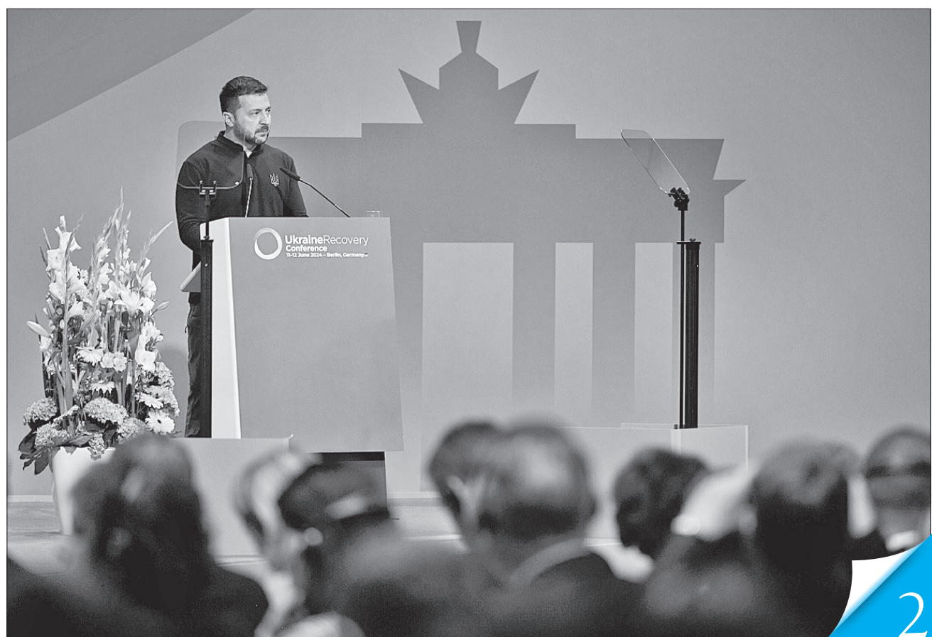
У виступі Президент України Володимир Зеленський зазначив, що такі заходи додають нам життєстійкості в умовах війни

ВИКЛИКИ. Міжнародна конференція з питань відновлення України в Берліні — майданчик для укладання важливих угод