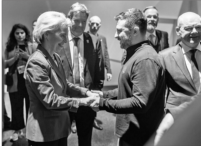
У Берліні Урсула фон дер Ляен повідомила, що ЄС разом із партнерськими європейськими банками створює фінансову програму на €1,4 млрд для приваблення в Україну зовнішніх капітальних інвестицій

Президент закликав зробити все, щоб зберегти наявну генерацію й відновити ту, яку Україна втратила через російську агресію.