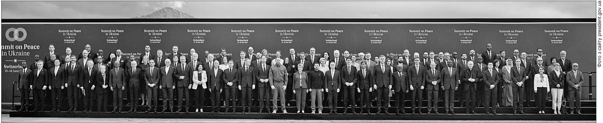
Цей історичний знімок учасники саміту зробили під вигуки «Слава Україні!» — «Героям слава!»