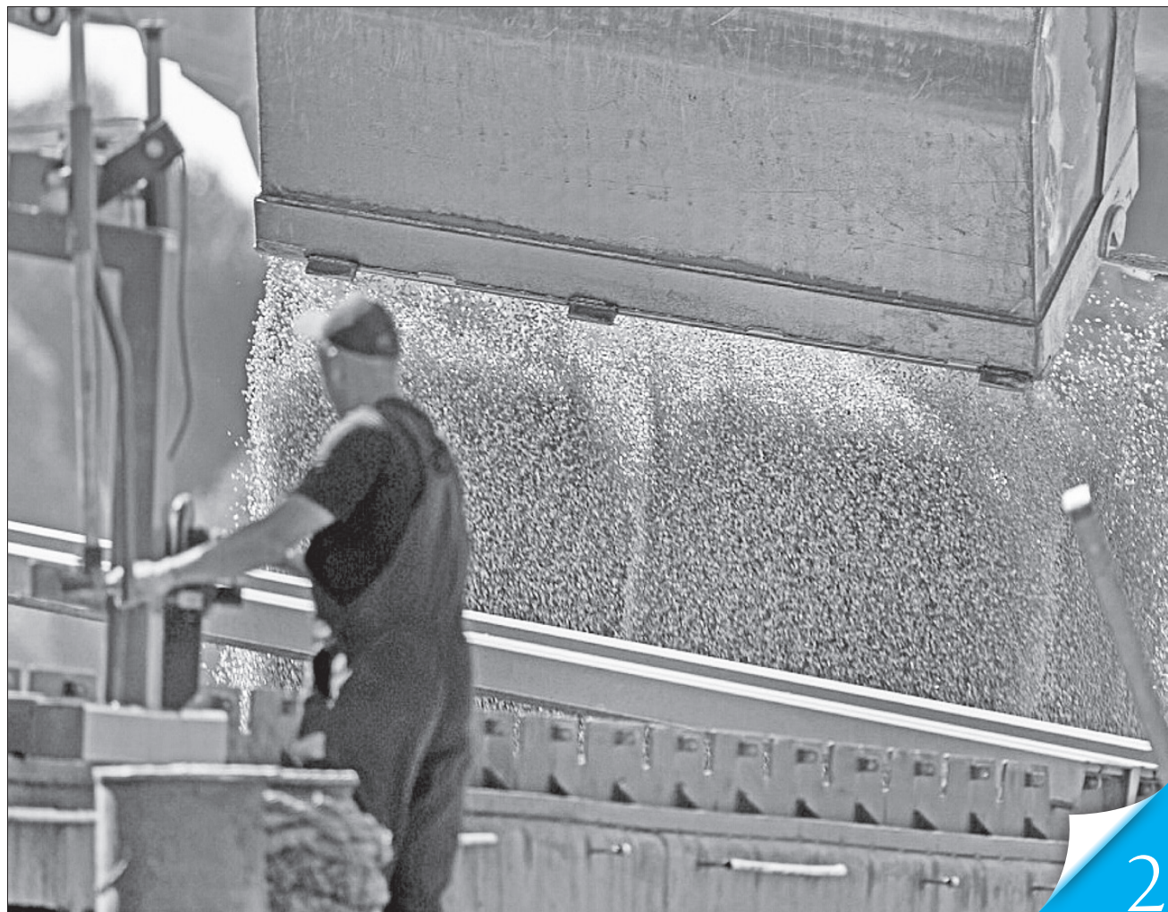
Вітчизняне зерно має за кордоном неабиякий попит

МІЖНАРОДНА ТОРГІВЛЯ. Україна поступово відновлює експортні позиції — передовсім в аграрному секторі, а ще — в металургії та машинобудуванні