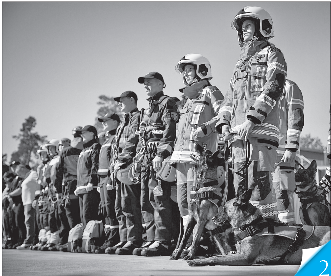
Глава держави відзначив представників Державної служби України з надзвичайних ситуацій

ЗА БУДЬ-ЯКИХ ОБСТАВИН. Президент Володимир Зеленський привітав із професійним святом українських рятувальників