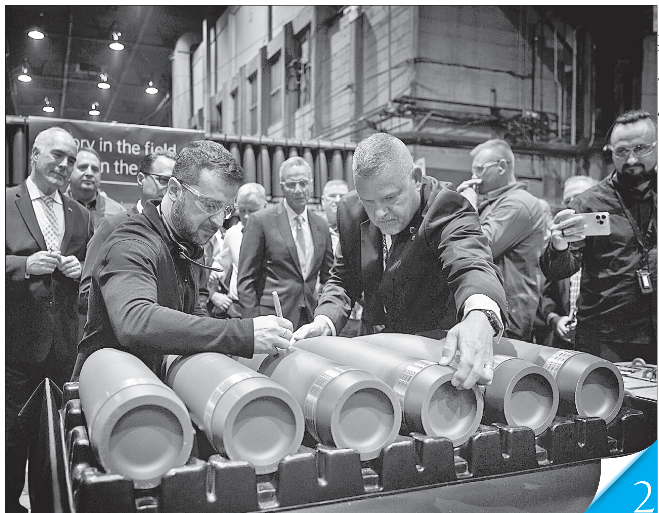
Володимир Зеленський розпочав візит з відвідання армійського боєприпасного заводу, на якому виробляють складові артилерійських і мінометних снарядів для ЗСУ

ВАЖЛИВИЙ ВІЗИТ. Президент Володимир Зеленський і українська делегація цього тижня працюють у США