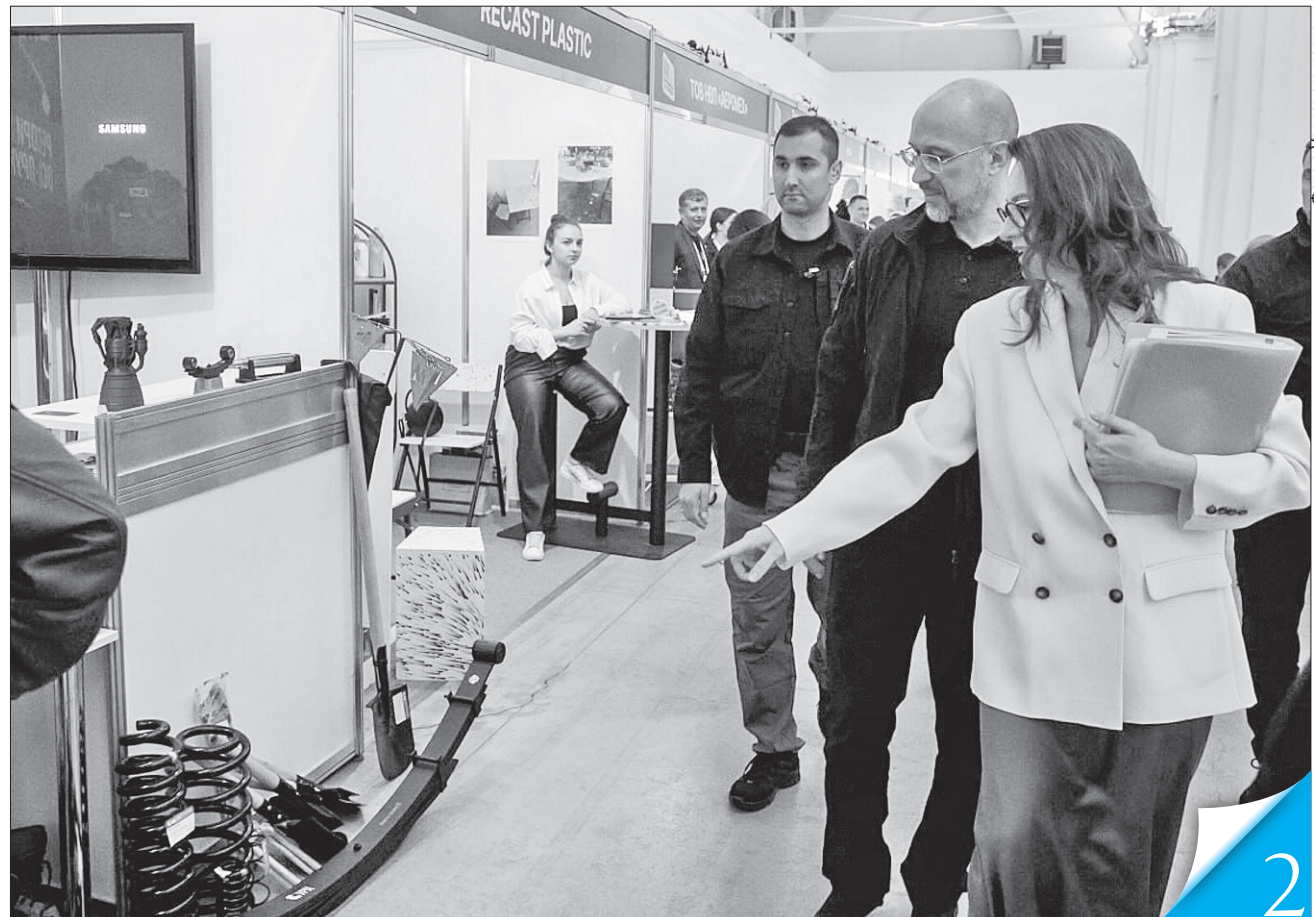
Прем'єр-міністр Денис Шмигаль і перший віцепрем'єр Юлія Свириденко ознайомилися з продукцією учасників заходу

ЕКОНОМІЧНА ПОЛІТИКА. Про допомогу держави та міжнародних інституцій підприємцям ішлося на форумі «Зроблено в Україні»